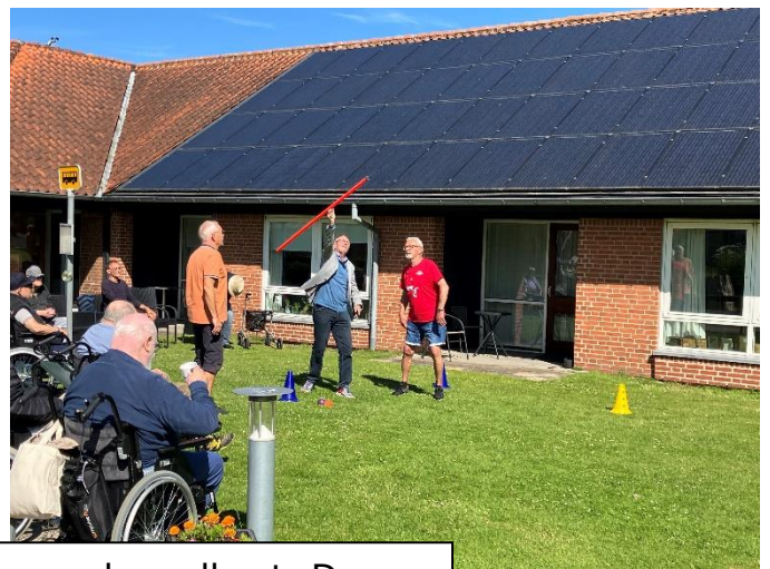
Herregruppen er i gang med spydkast. De var supergode og kastede helt op til +7 meter. Virkelig godt gået.