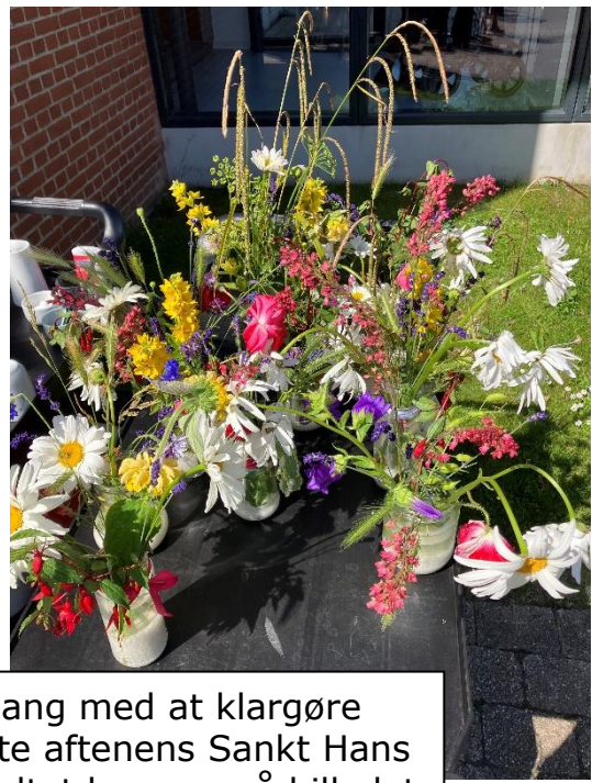
Damegruppen er i gang med at klargøre vaserne, som skal pynte aftenens Sankt Hans borde. Det færdige resultat kan ses på billedet til højre.